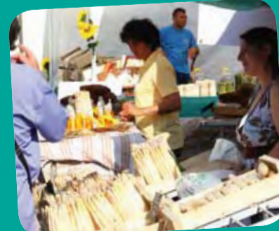
Fête de l'asperge du blayais