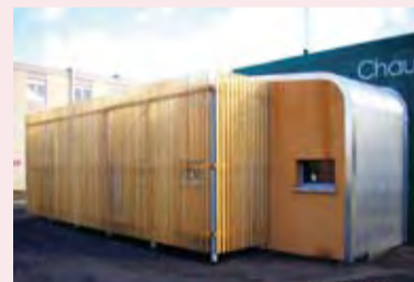
Ouvrages réalisés par l'entreprise A2M Proximétal