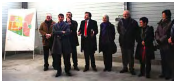
Pose de la 1 ère pierre du Parc d'activités «Les Pins» le 22 janvier 2011

La Communauté de Communes de l'Estuaire vient de terminer les aménagements du Parc d'activités «Les Pins», réalisés pour un montant total d'investissement de 1.5 Millions d'euros. Ce sont ainsi 18 terrains , d'une surface comprise entre 1 600 et 23 000m 2 , situés aux portes de l'autoroute A10 qui sont mis en vente.