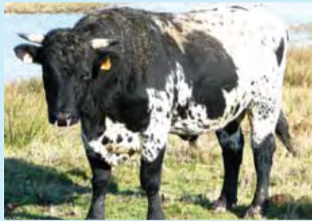
Byzance 900 petits kilos

Le conservatoire des Races Rustiques d'Aquitaine est un partenaire important de la Commune de Braud Saint Louis et de la CCE puisqu'une partie de Terres d'Oiseaux est entretenue par des animaux rustiques. Au-delà de la mission de conservation de ces races, cette action permet une gestion des milieux plus écologique et plus adaptée. Byzance, taureau qui est resté sur le site durant deux ans, a d'ailleurs été présenté au public girondin au sein du salon de l'agriculture aquitain de la Foire internationale de Bordeaux.