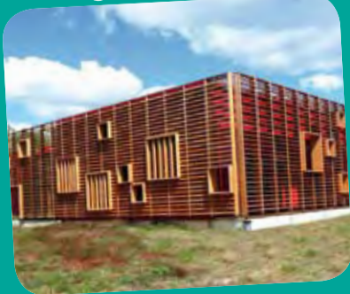
Inauguration du CFM