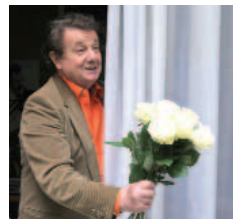
"Oncle Vania" avec M. Maréchal par les Tréteaux de France

Le vieux professeur Serebria Kor s'est retiré à la campagne, dans la maison de sa première épouse. Cette arrivée perturbe la vie paisible de sa fille Sonia et d'oncle Vania, qui, à eux deux, exploitent tant bien que mal le domaine. D'autant que l'attention de tous (y compris celle de Vania et du médecin Astrov) se cristallise bientôt sur Elena, la seconde et très désirable épouse du professeur.