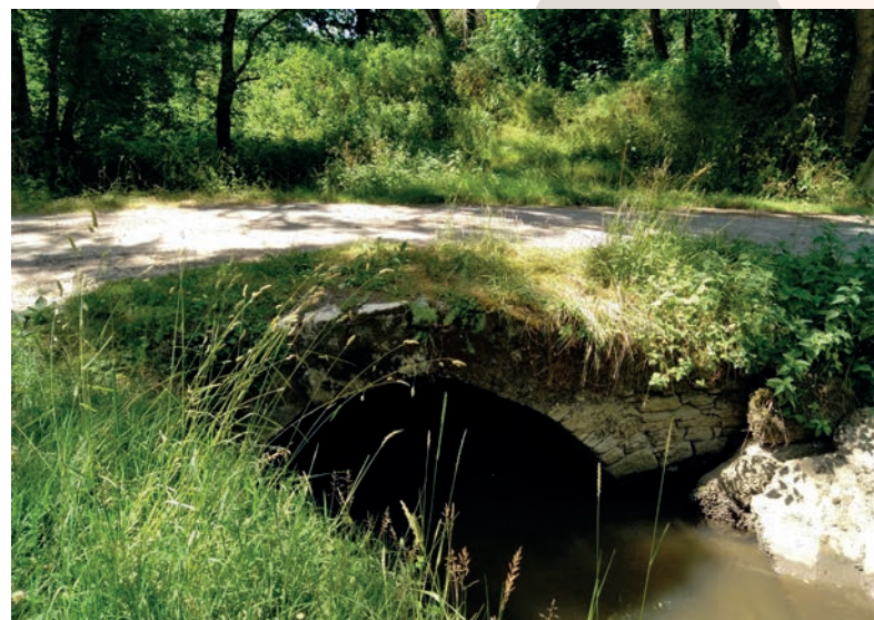
Pont de Marquet à Braud-et-Saint-louis

Ce projet est soutenu financièrement par la DREAL et la Région Nouvelle Aquitaine. Il est porté par la Ligue de Protection des Oiseaux (LPO) avec l'appui de la Cdc de l'Estuaire, du Syndicat du Moron et d'Agence MTDA.