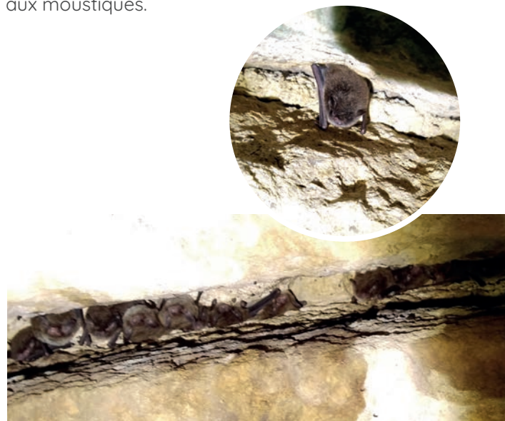
Le Murin de Daubenton, Myotis daubentonii

Loin de nous l'idée de la chauve-souris buveuse de sang ! En France, les chiroptères sont insectivores et sont donc de précieux alliés pour réguler les populations d'insectes ravageurs des cultures, ou bien encore pour s'attaquer aux moustiques.